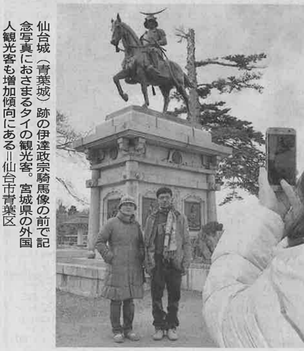
仙台城(青葉城)跡の伊達政宗騎馬像の前で記念写真におさまるタイの観光客。宮城県の外国人観光客も増加傾向にある。仙台市青葉区

ただ、訪日客全体に占める東北の割合は約1%のみで知名度は低い。人口減少と高齢化の先進地として交流人口の拡大は喫緊の課題で、政府は2020年までに15年の約3倍となる宿泊者150万人を目標としている。 連合は、こうした国の事業を取り込むことも見据えている。まずは1千万円規模の事業を受注し、成功例をつくるのが目的だ。セミナーの開催など連合主催の事業も進める。参加企業の約半分が宮城県内なので、将来は他県の事業者を増やすことも視野に入れている。(木村聡史)